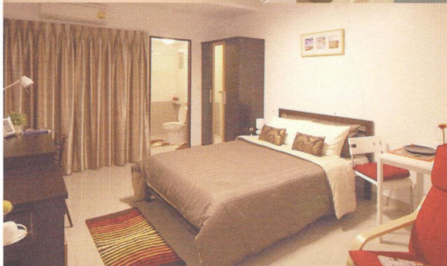
▲ ภาพบรรยากาศภายในห้องพัก อพาร์ทเมนต์ Better Place