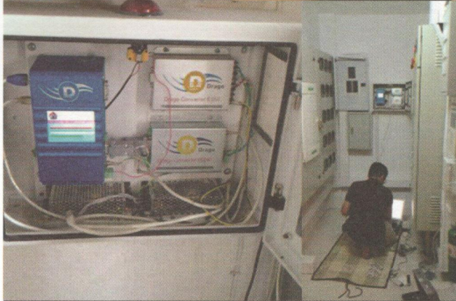
▲ ระบบมิเตอร์น้ำดิจิตอล DRAGO

เนื่องจากมีประสบการณ์ในการดูแลซ่อมแซมบ้านมาพอสมควรครับ ทำให้ผมทราบว่า การใช้วัสดุอุปกรณ์ที่มีคุณภาพดี มีมาตรฐานนั้นคุ้มค่ากว่ามาก เพราะทนทาน ไม่ต้องเสียเวลา เสียเงินในการซ่อมแซมในภายหลัง โดยส่วนใหญ่ผมทราบยี่ห้อที่ได้อยู่แล้ว ส่วนอันไหนที่ไม่ทราบผมก็ทำการค้นหาคึกษาเพิ่มเติมทางอินเทอร์เน็ตครับ